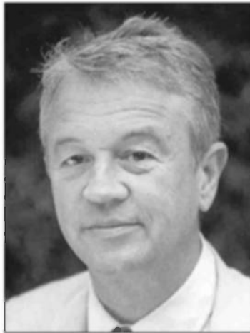
המו"ל אנטואן גאלימאר